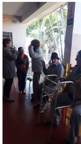
Visita do Setor Nossa Senhora Aparecida – 07/07/2019