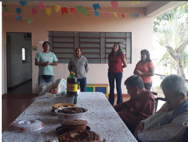
Visita dos membros da igreja Metodista – Alv. Machado – 21/07/2019