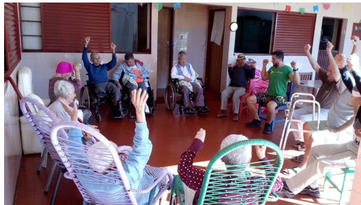
Realizado em 24/07/2019