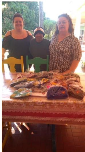
Visita das voluntárias Corrente do Amor (Pres. Venceslau) – doação de meias e toucas de lã – 23/07/2019