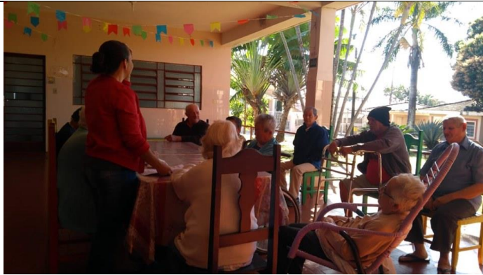
Atividade realizada em 12/072019 – CONTAÇÃO DE HISTORIA: A MENINA DO LEITE.