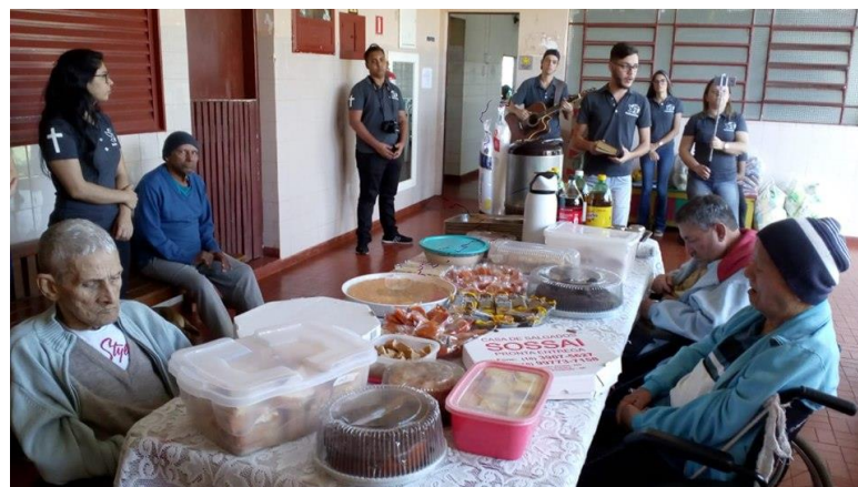
Visita dos membros da igreja Ministério Mudança de Vida – Pres. Prudente – 20/07/2019