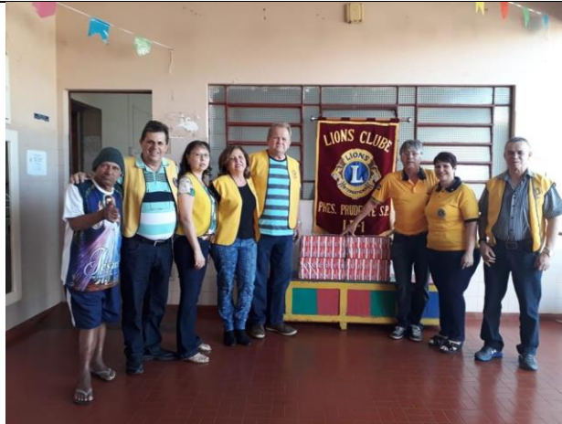
Visita do pessoal do Lions Clube de Pres. Prudente – 13/07/2019 (doação de leite)