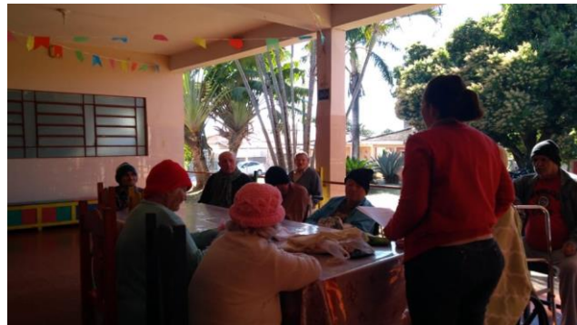
Atividade realizada em 08/07/2019 – CONTAÇÃO DE HISTÓRIA: A CIGARRA E A FORMIGA.