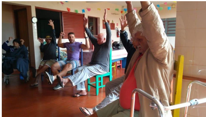
Realizado em 03/07/2019