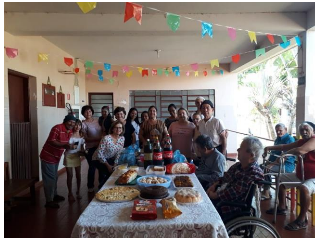
Visita dos membros do Setor São Paulo – 14/07/2019