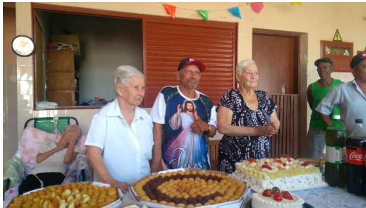
Realizada em 25/07/2019