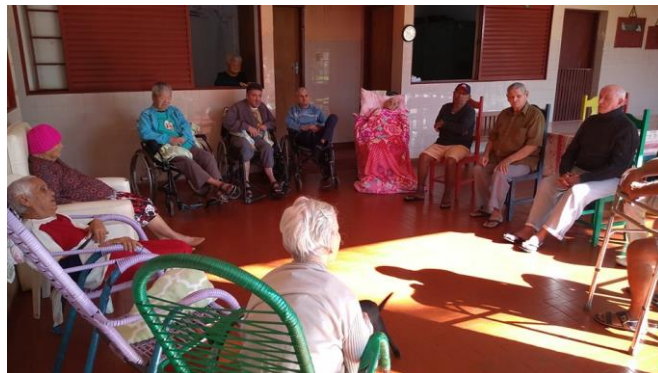
Realizado em 30/07/2019