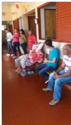
Visita dos membros da Igreja Assembléia de Deus – Pres. Prudente – 27/07/2019