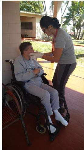
Realizado em 29/07/2019