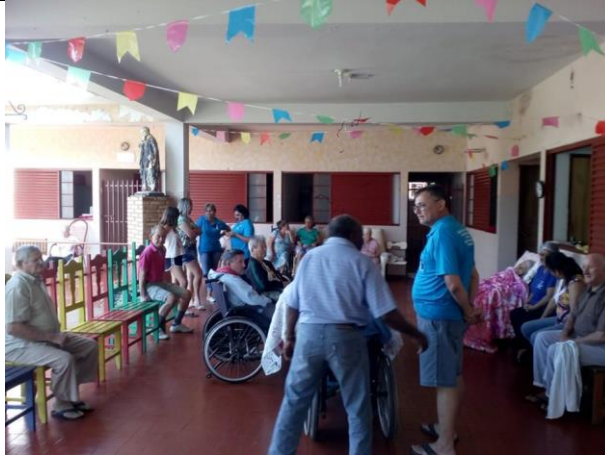
Visita do grupo das esposas dos diretores da ilpi – 28/07/2019