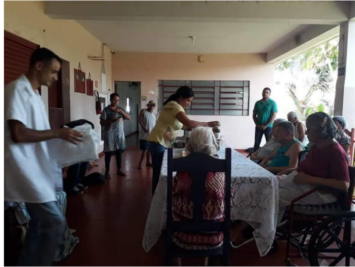
IBMR – 02/02/2019