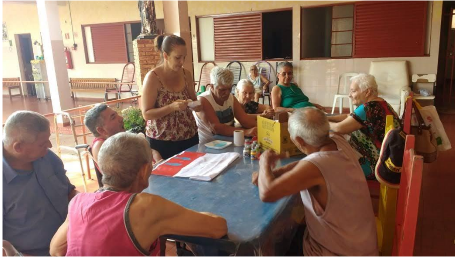
Atividade realizada em 01/02/2019 – CONTAÇÃO DE HISTÓRIA: O PORCO ESPINHO + OFICINA DE PINTURA EM PANO DE PRATO