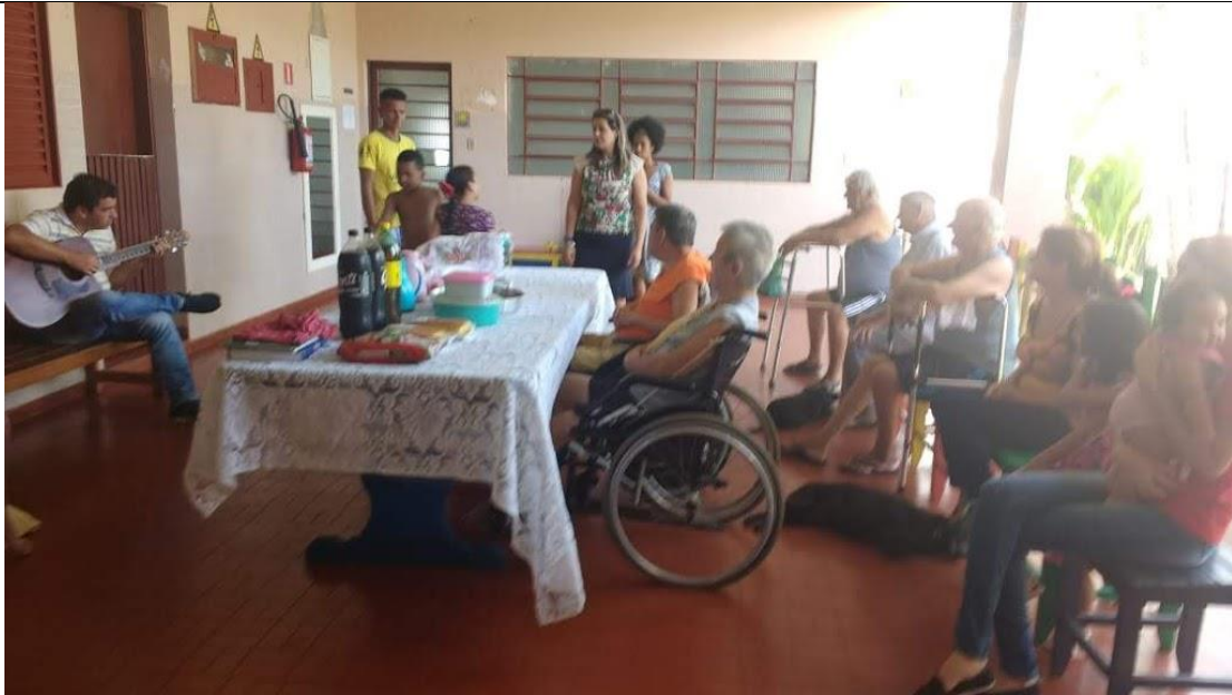
Visita dos membros da Igreja Assembléia de Deus – Pres. Prudente – 23/02/2019

ASSOCIAÇÃO LAR DOS IDOSOS DE ALVARES MACHADO Rua Campos Salles, nº 10 – CEP 19.160-000 - Fone (018) 3273 - 1542 Álvares Machado – SPCNPJ 51.400.000/0001-10 E-mail: lardosidososdam@yahoo.com.br