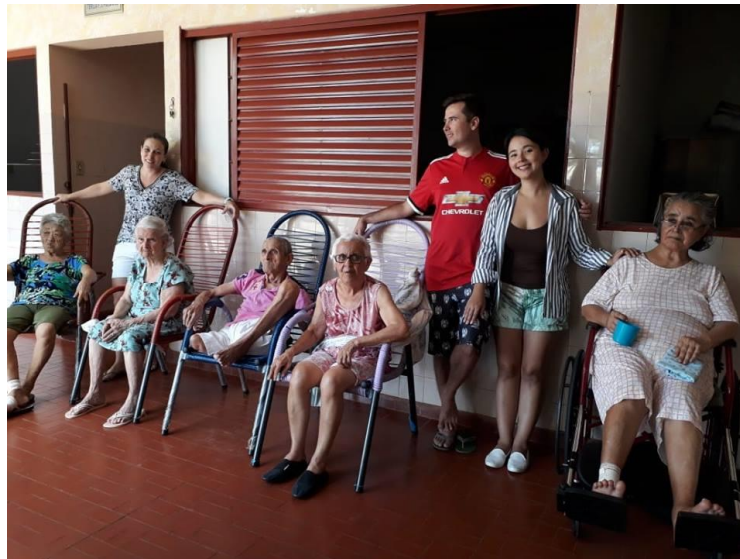
Visita Grupo de amigos CURARISOS – 09/02/2019