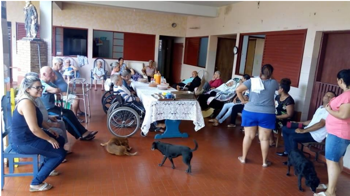
Visita dos membros da Casa de Oração para todos os povos – Alv. Machado – 28/02/2019