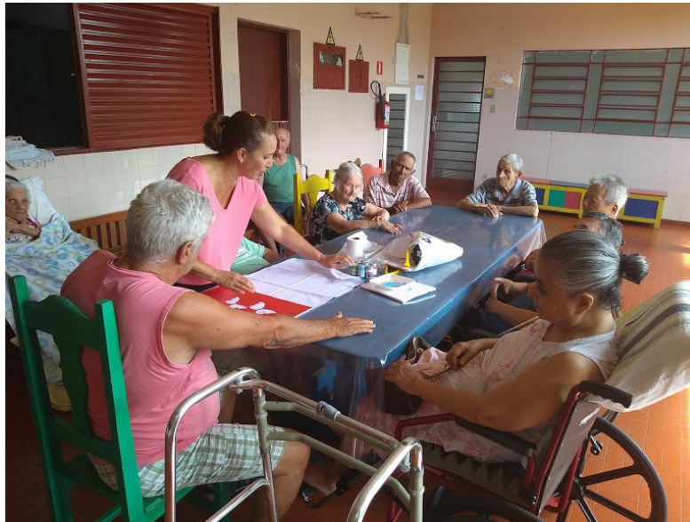
Atividade realizada em 22/02/2019 – CONTAÇÃO DE HISTÓRIA: AS TRÊS PERGUNTAS DO REI + OFICINA DE PINTURA EM PANO DE PRATO