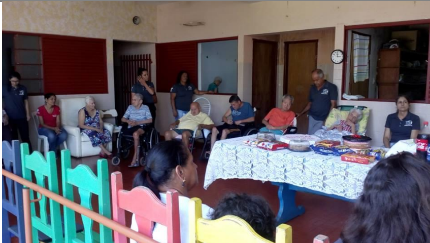
Ministério Mudança de Vida – Pres. Prudente – 16/02/2019

ASSOCIAÇÃO LAR DOS IDOSOS DE ALVARES MACHADO Rua Campos Salles, nº 10 – CEP 19.160-000 - Fone (018) 3273 - 1542 Álvares Machado – SPCNPJ 51.400.000/0001-10 E-mail: lardosidososdam@yahoo.com.br