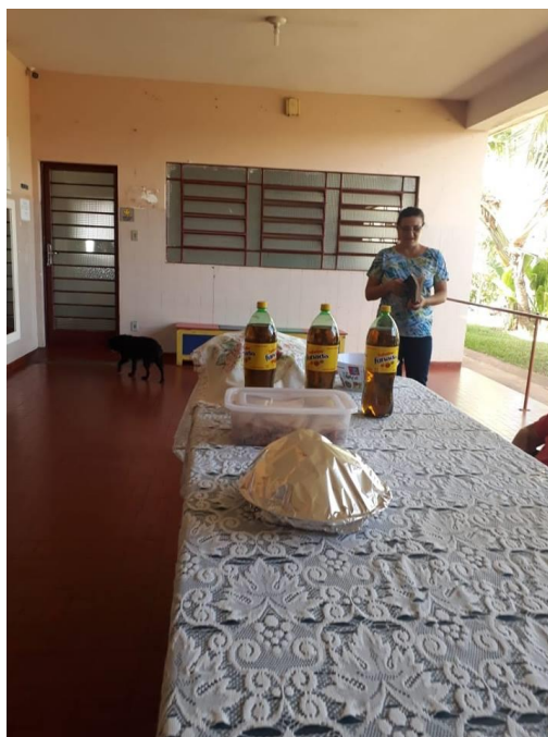
Visita dos membros da Igreja Metodista – Alv. Machado – 16/02/2019