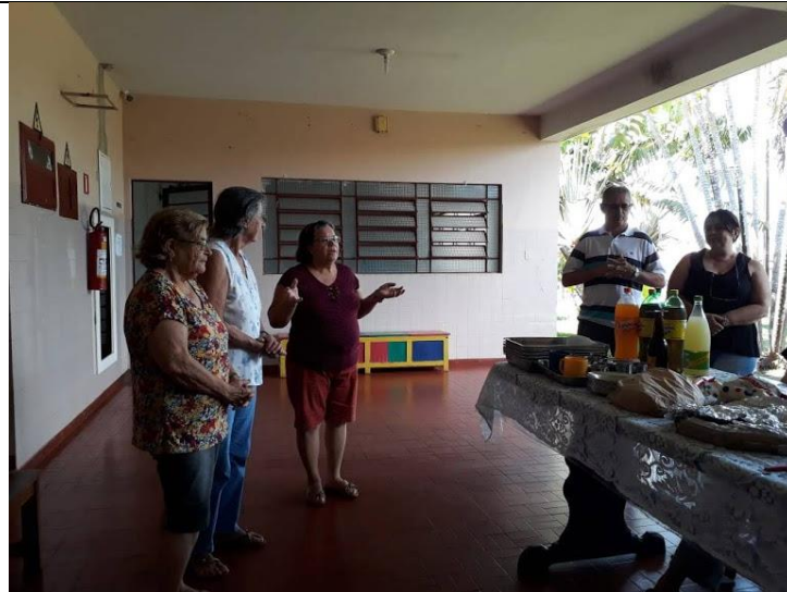
Setor São João – 11/11/2018