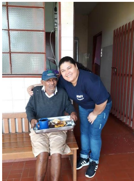
Ministério Mudança de Vida – Pres. Prudente – 10/11/2018