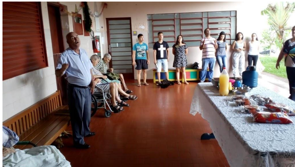
Metodista – A. Machado – 18/11/2018