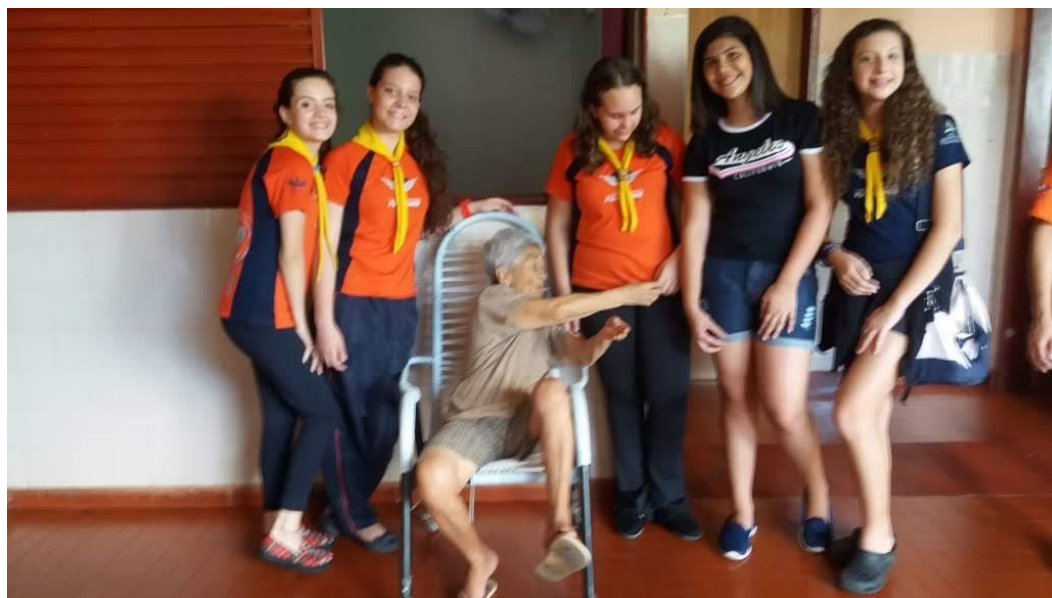
Clube de Desbravadores – Pres. Prudente – 03/11/2018