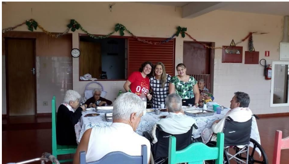
Assembléia de Deus – Pres. Prudente – 24/11/2018