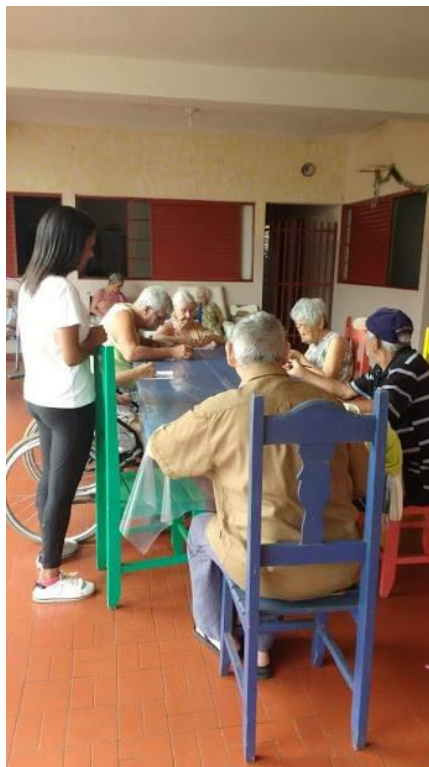
Atividade com os estagiários de psicologia – coordenação motora e criatividade – 29/11/2018