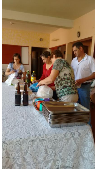
Setor São Tiago Bartolomeu – 25/11/2018