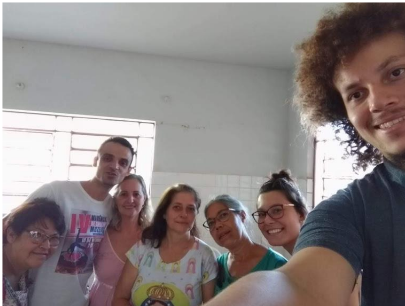
Grupo 1: encontro nos dias 13/11 e 21/11/2018