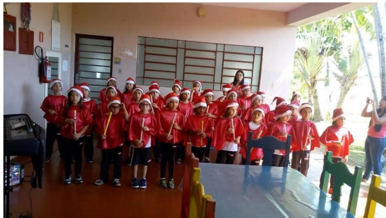
Cantata de Natal com os alunos do SESI – Alv. Machado – 27/11/2018