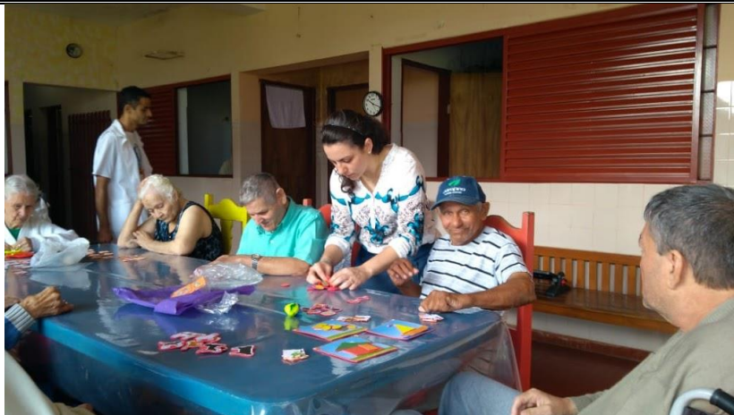
Atividade com a estagiária de psicologia – coordenação motora e preservação da memória – 06/11/2018