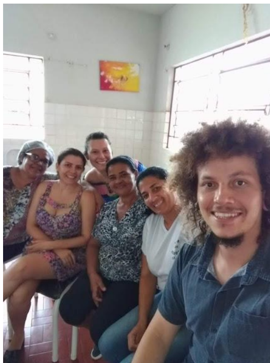
GRUPO 2: encontro nos dias 14/11 e 20/11/2018.