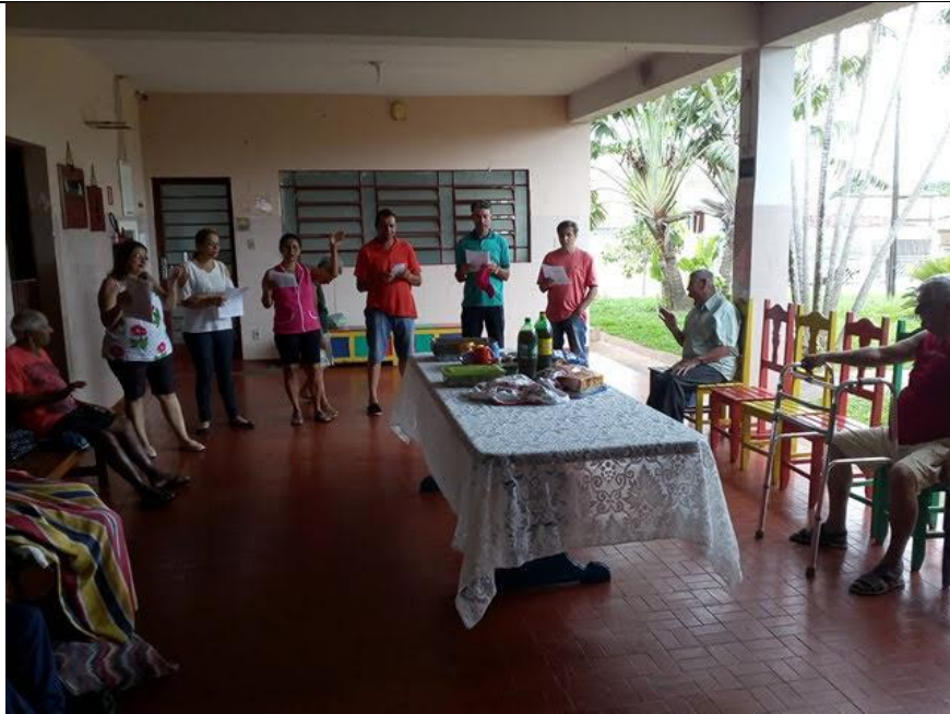
Setor Santo Expedito – 04/11/2018