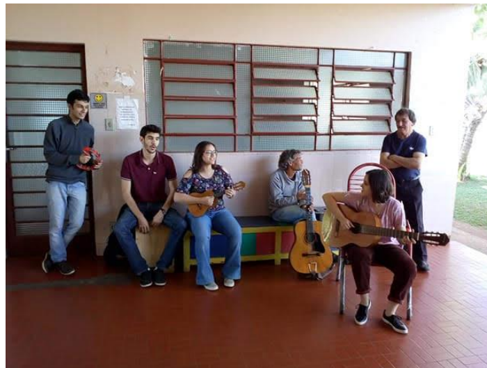
Setor São Tiago Maior – 26/08/2018