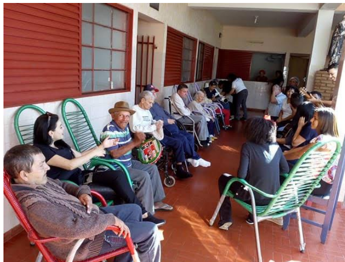
Ministério Mudança de Vida – Pres. Prudente – 18/08/2018