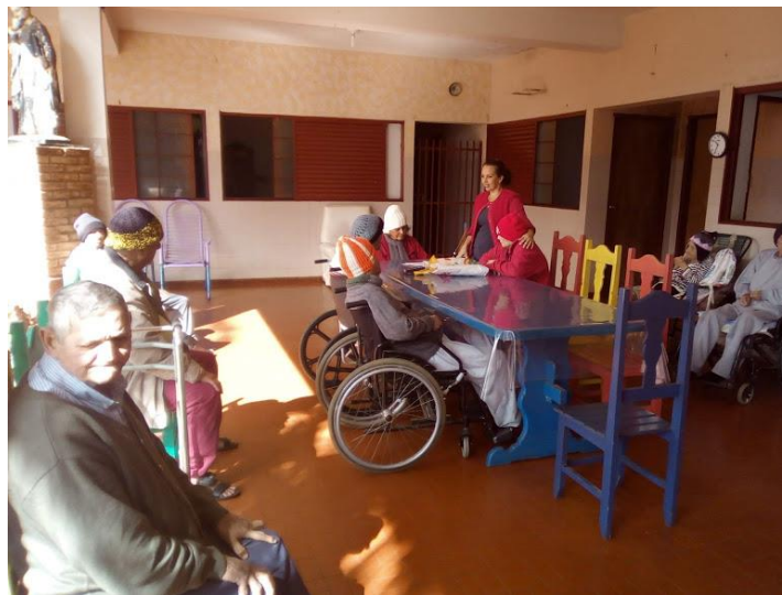
Atividade realizada em 10/08/2018 – CONTAÇÃO DE HISTÓRIA – A VAQUINHA + ATIVIDADE DIA DOS PAIS