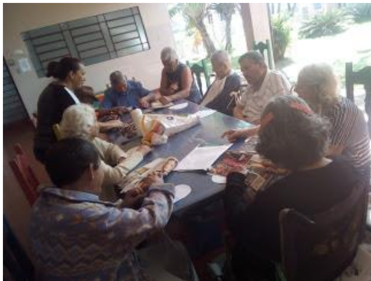
Atividade realizada em 31/08/2018 – CORAÇÃO PARTIDO + atividade de colagem.