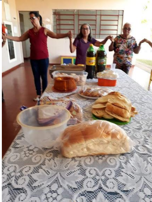
Setor São Francisco – 12/08/2018