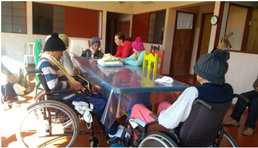
Atividade realizada em 17/08/2018 – contação de história: A IMPORTÂNCIA DA NOSSA CULTURA.