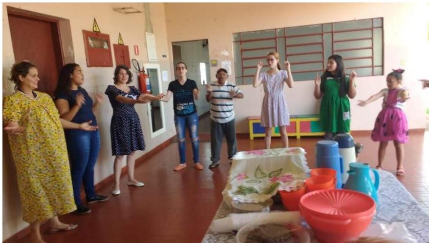
Assembléia de Deus – Pres. Prudente – 25/08/2018