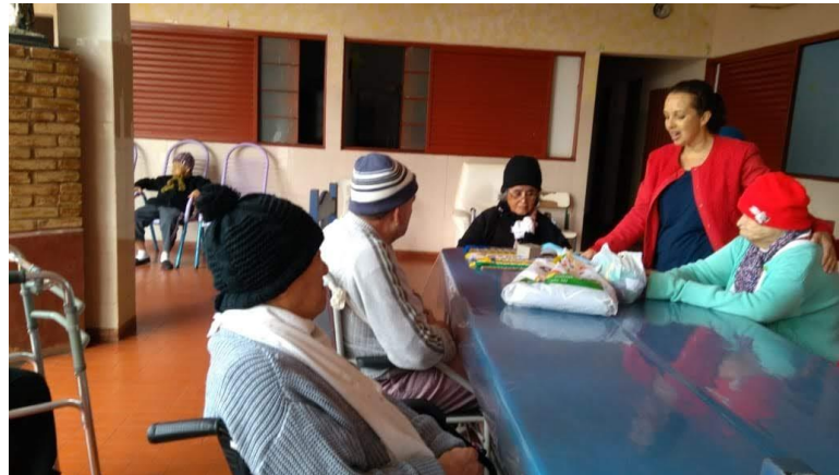
Atividade realizada em 03/08/2018 – CONTAÇÃO DE HISTÓRIA: A RENOVAÇÃO DA ÁGUA.