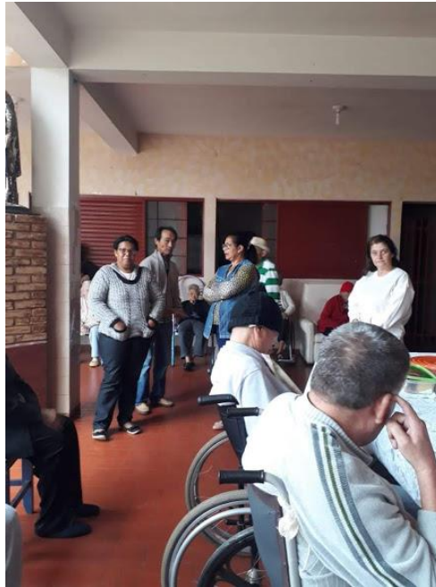
Setor São Judas Tadeu – 05/08/2018