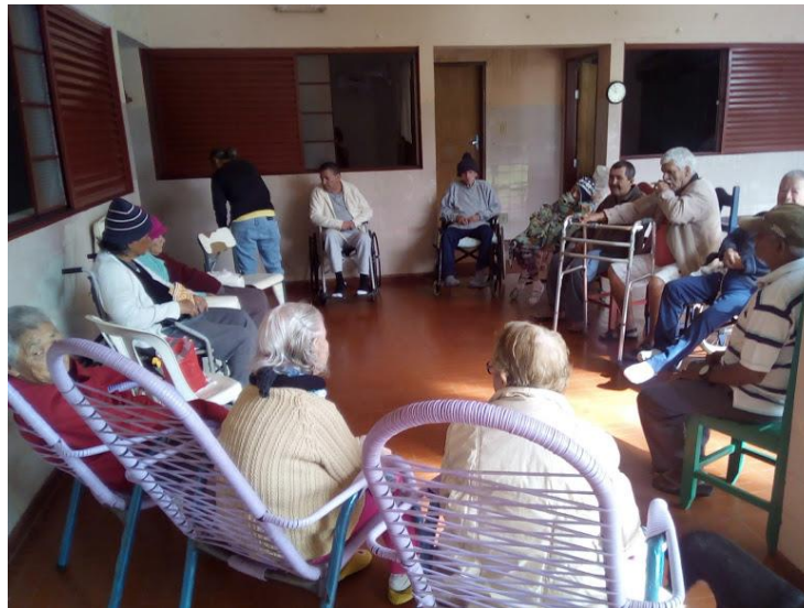
Realizado em 15/08/2018