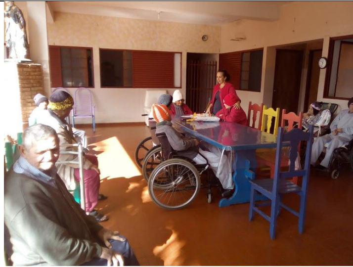
Atividade realizada em 10/08/2018 – CONTAÇÃO DE HISTÓRIA – A VAQUINHA + ATIVIDADE DIA DOS PAIS