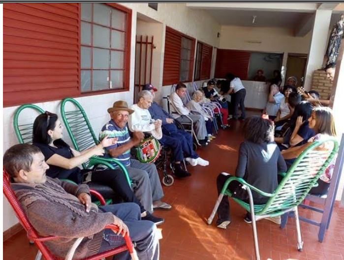
Ministério Mudança de Vida – Pres. Prudente – 18/08/2018