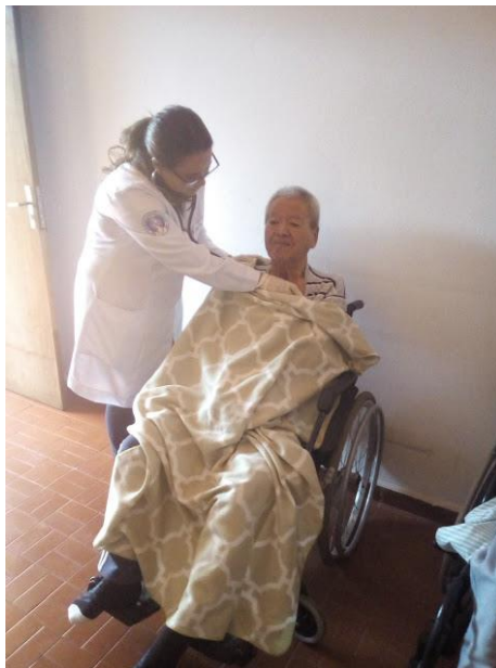
Atendimento feito em 06/08/2018 e 13/08/2018