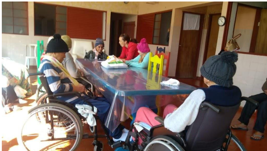
Atividade realizada em 17/08/2018 – contação de história: A IMPORTÂNCIA DA NOSSA CULTURA.