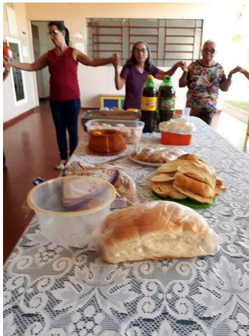
Setor São Francisco – 12/08/2018