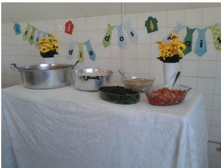
Almoço realizado em 12/08/2018