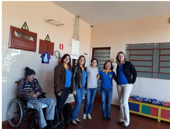
Café da tarde especial em comemoração ao DIA DOS PAIS – com ROTARY CLUBE DE ALVARES MACHADO – 11/08/2018