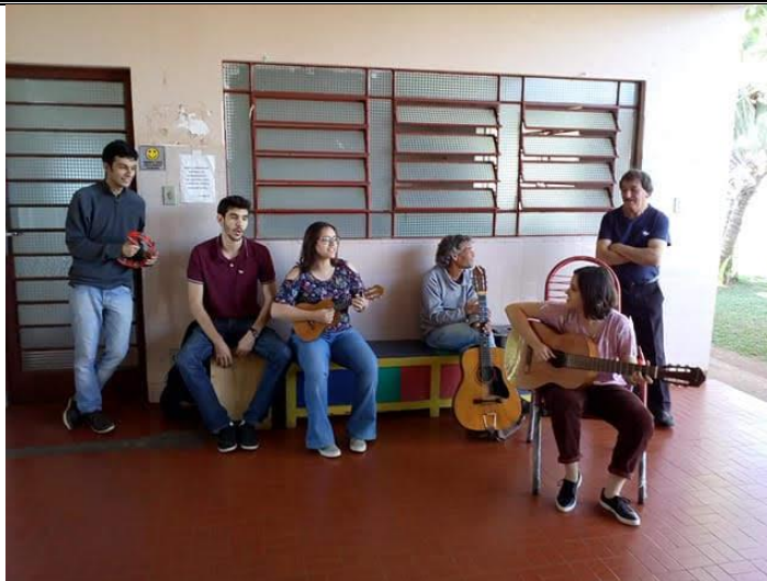
Setor São Tiago Maior – 26/08/2018