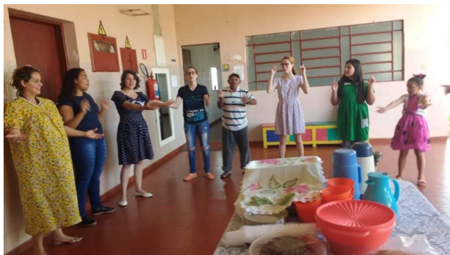
Assembléia de Deus – Pres. Prudente – 25/08/2018