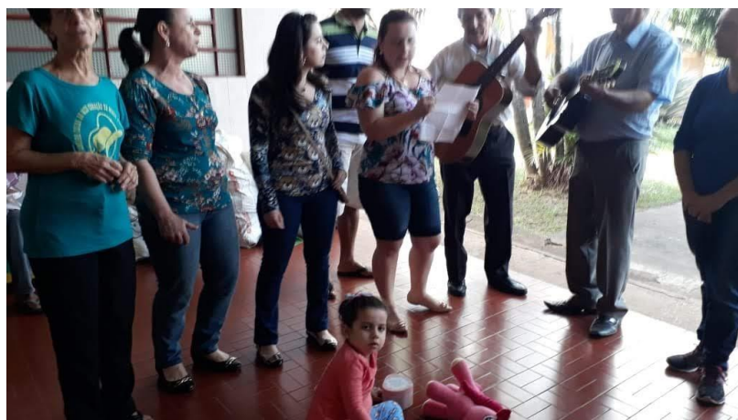
Setor São Matias – 03/06/2018