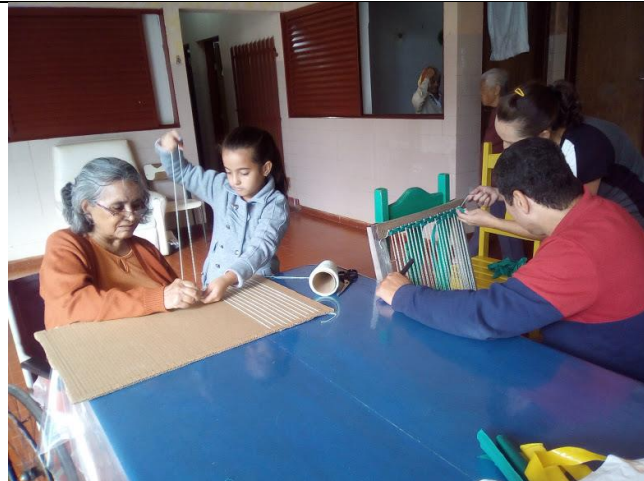
Atividade realizada em 01/06/2018 – O VENTO E O SOL + OFICINA DE TAPETES E ARTES