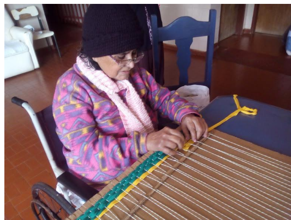
Oficina de tapetes – 15/06/2018