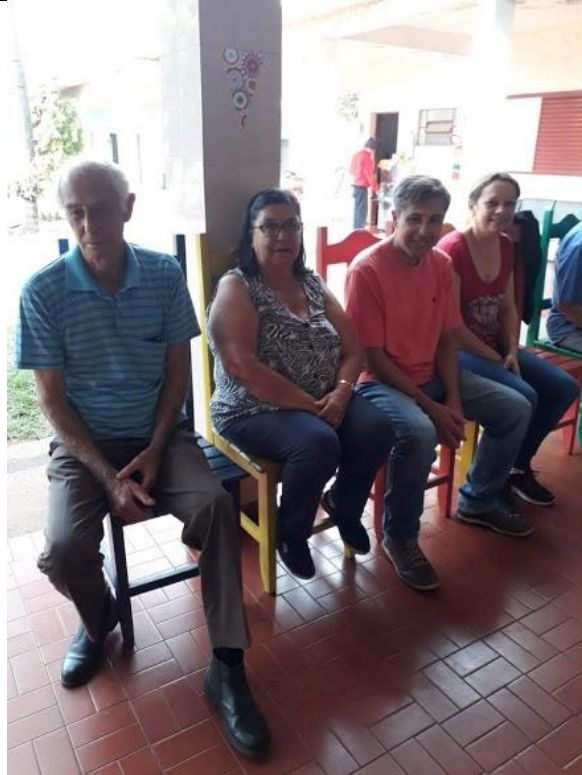
Setor Santo Expedito – 10/06/2018