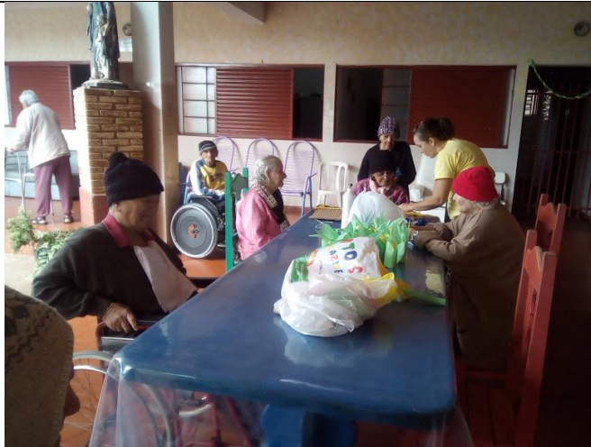
Atividade realizada em 15/06/2018 – TORRADAS QUEIMADAS + OFICINA DE ARTES (TEMA JUNINO)