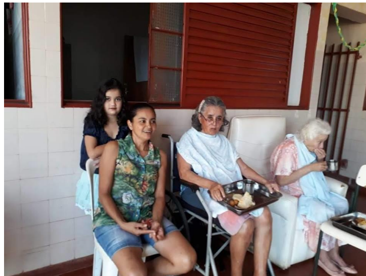
Setor São João – 24/06/2018