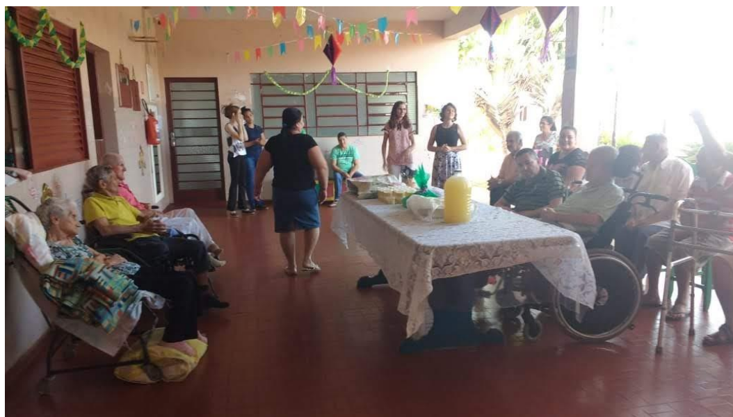
Assembléia de Deus – Pres. Prudente – 30/06/2018