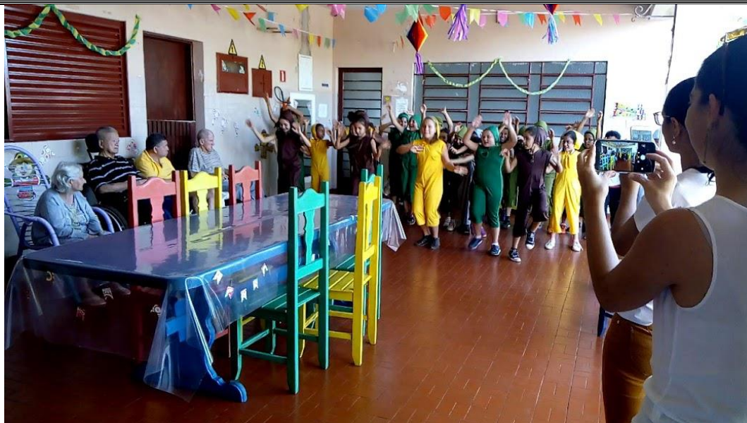
3º ano do fundamental – ESCOLA SESI – Apresentação de dança e contação de história – 29/06/2018