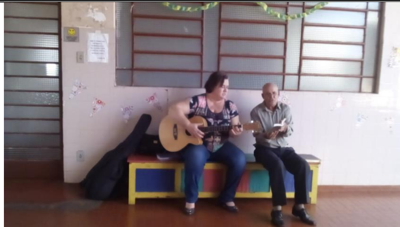
Membros da igreja Metodista – Alv. Machado – 17/06/2018