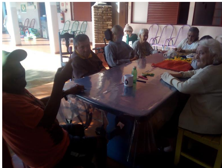
CONTAÇÃO DE HISTÓRIA – A CIGARRA E A FORMIGA + DINAMICA A CAIXA DE PANDORA –