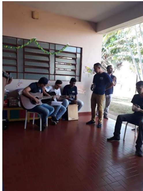
Ministério Mudança de Vida – Pres. Prudente – 16/06/2018