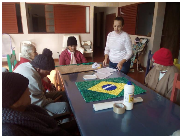
Atividade realizada em 08/06/2018 – SEMENTES + OFICINA DE TAPETES E ARTES