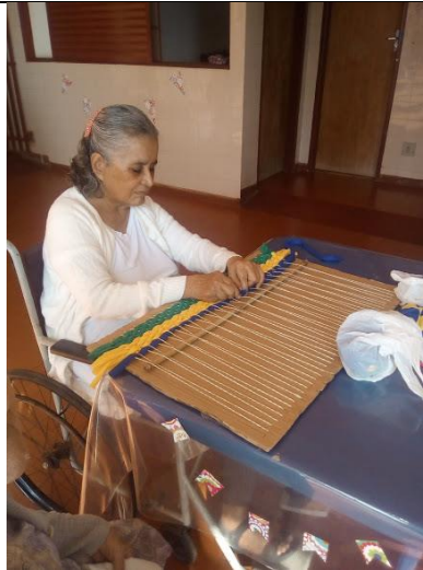
OFICINA DE TAPETES – 29/06/2018