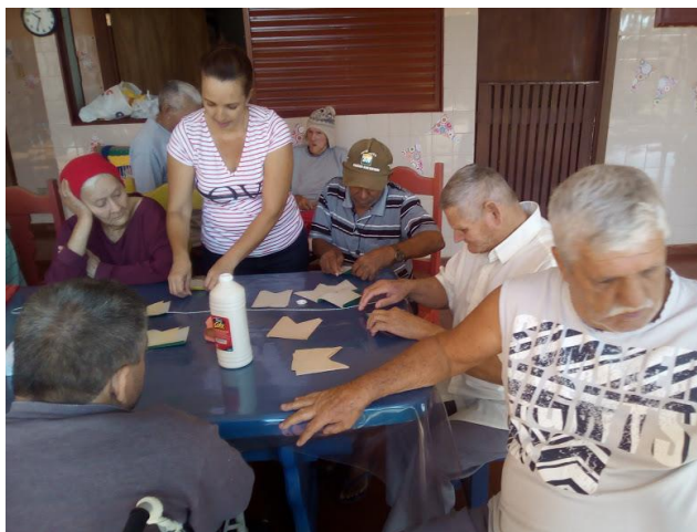
CONTAÇÃO DE HISTÓRIA – A CHINESA E O VASO QUEBRADO + OFICINA DE ARTES – DECORAÇÃO JUNINA – 21/06/2018