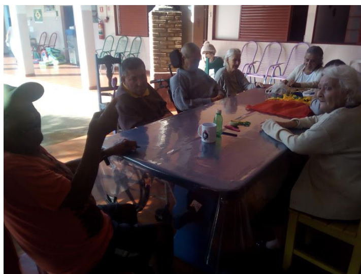
CONTAÇÃO DE HISTÓRIA – A CIGARRA E A FORMIGA + DINAMICA A CAIXA DE PANDORA –