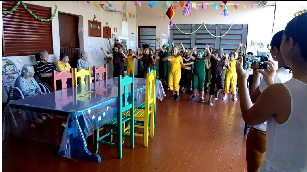
3º ano do fundamental – ESCOLA SESI – Apresentação de dança e contação de história – 29/06/2018