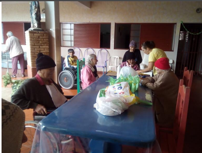
Atividade realizada em 15/06/2018 – TORRADAS QUEIMADAS + OFICINA DE ARTES (TEMA JUNINO)