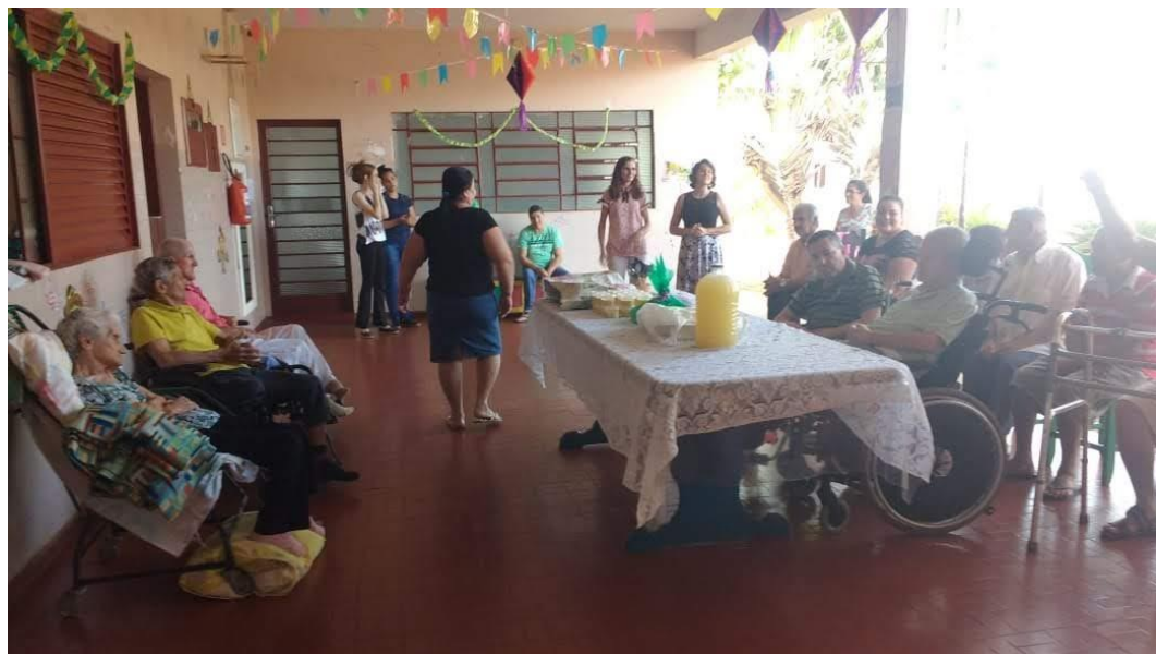
Assembléia de Deus – Pres. Prudente – 30/06/2018