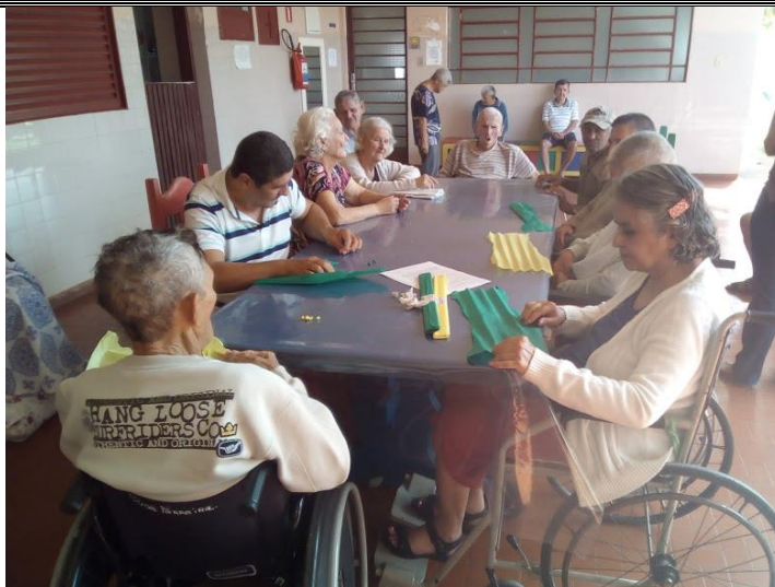
Atividade realizada em 11/05/2018 – A CORUJA E A ÁGUIA + OFICINA DE ARTES