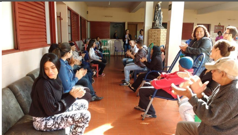
Ministério Mudança de Vida – Pres. Prudente – 19/05/2018