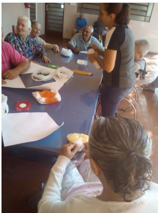
Atividade realizada em 18/05/2018 – A PAZ INTERIOR + OFICINA DE ARTES