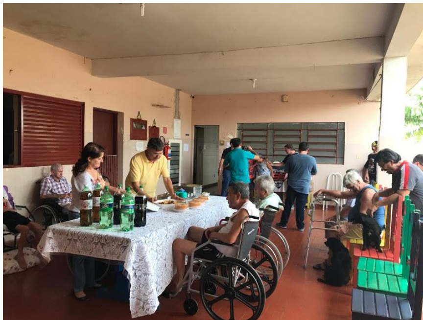
Visita do 99 Moto Club – Pres. Prudente – realizada em 05/05/2018