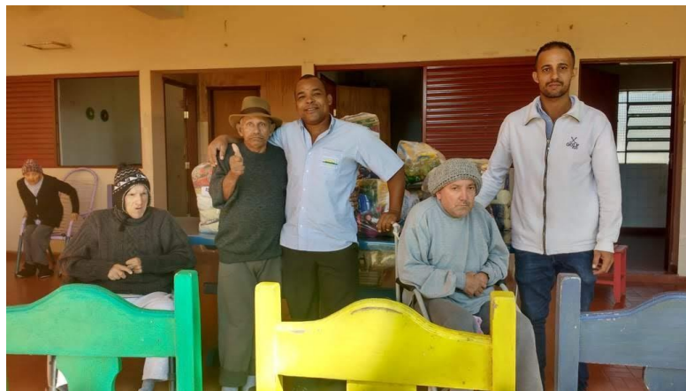
Doação de 10 cestas básicas – Multi Itens de Pres. Prudente – 21/05/2018