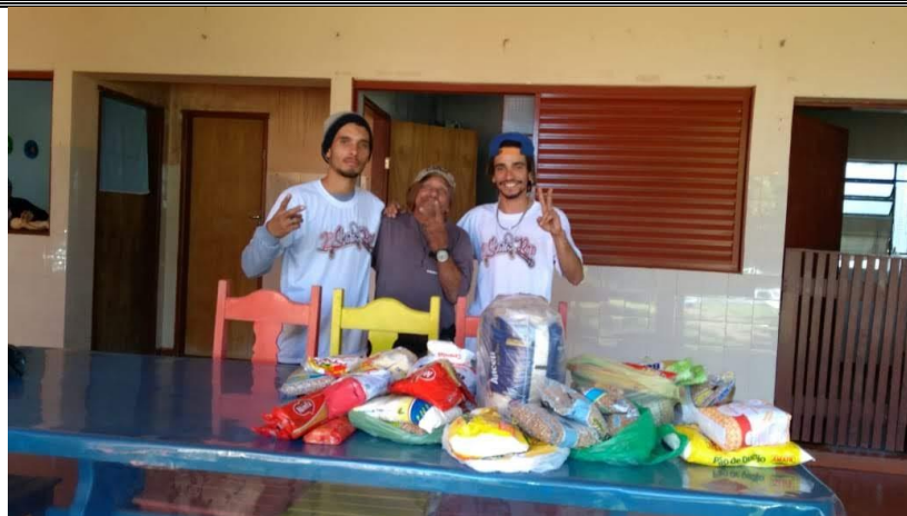
Doação de alimentos arrecadados no evento 2º Skaterap – 20/05/2018