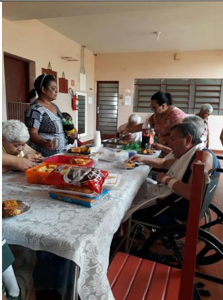
Setor Nossa Senhora Aparecida – 06/05/2018