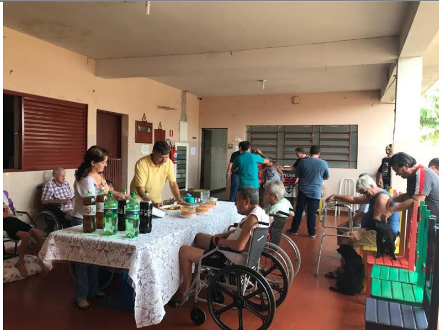
Visita do 99 Moto Club – Pres. Prudente – realizada em 05/05/2018