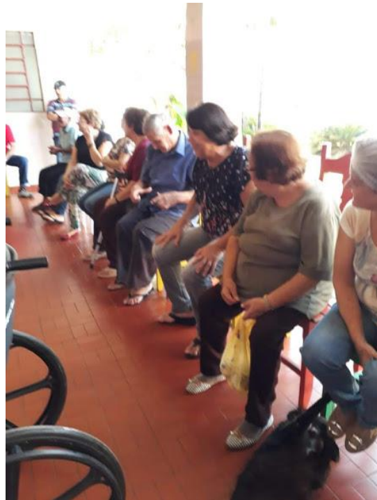
Setor São Mateus – 27/05/2018