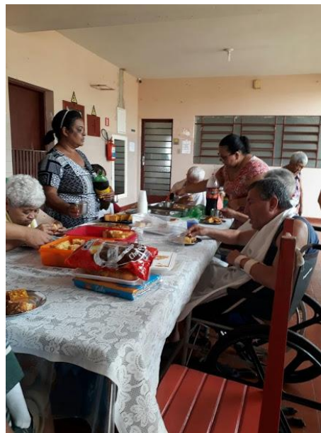
Setor Nossa Senhora Aparecida – 06/05/2018