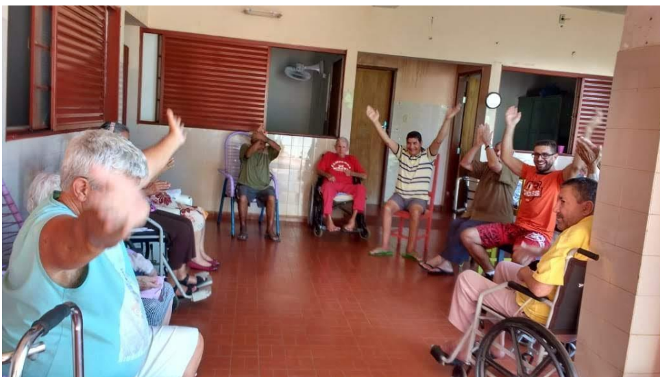
Realizada em 18/05/2018