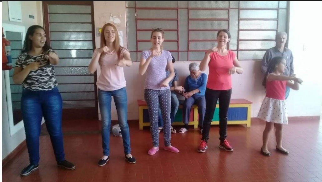
Assembléia de Deus – Pres. Prudente – 26/05/2018