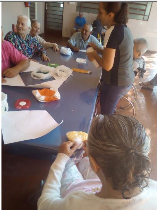
Atividade realizada em 18/05/2018 – A PAZ INTERIOR + OFICINA DE ARTES