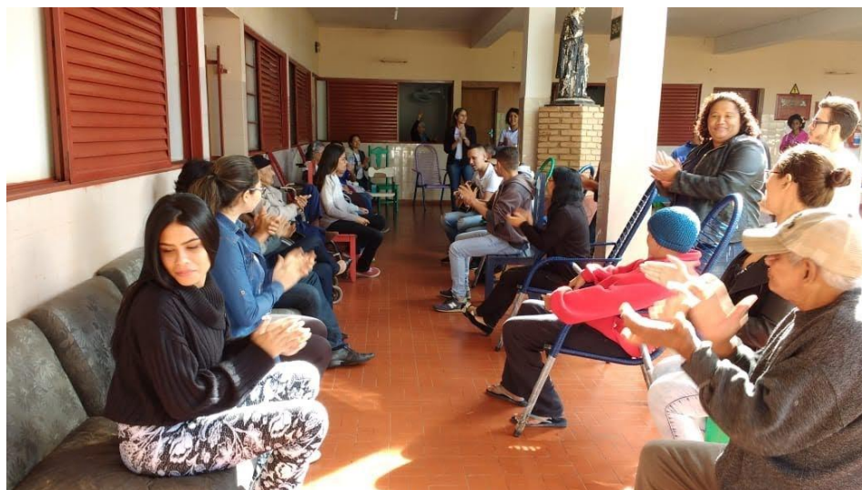
Ministério Mudança de Vida – Pres. Prudente – 19/05/2018