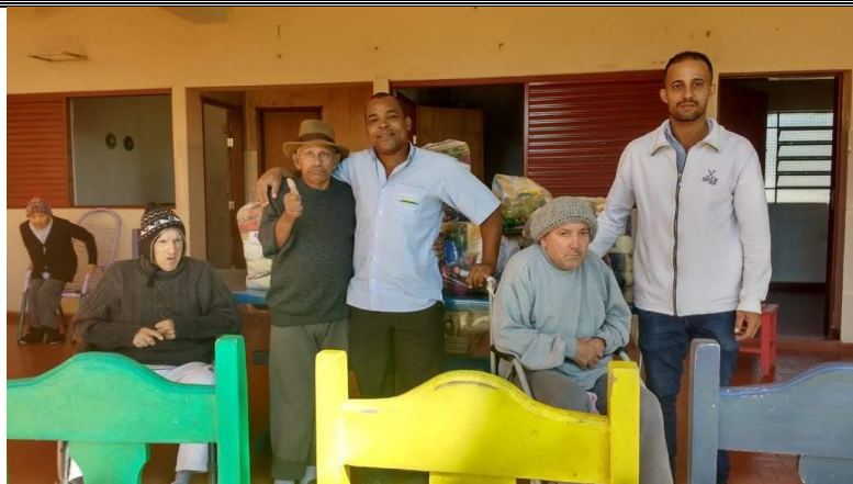
Doação de 10 cestas básicas – Multi Itens de Pres. Prudente – 21/05/2018