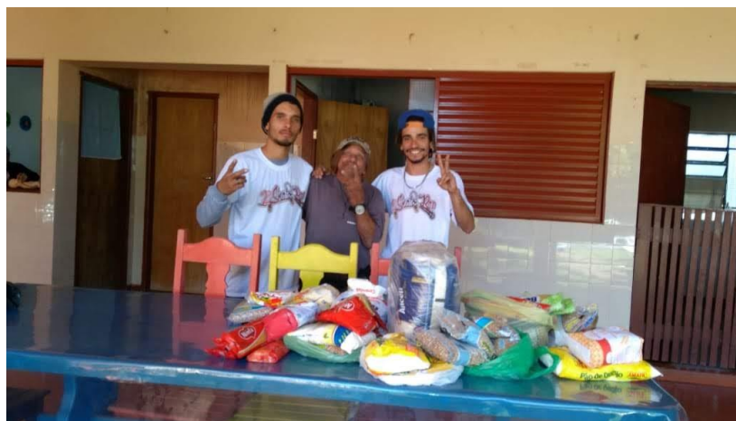
Doação de alimentos arrecadados no evento 2º Skaterap – 20/05/2018