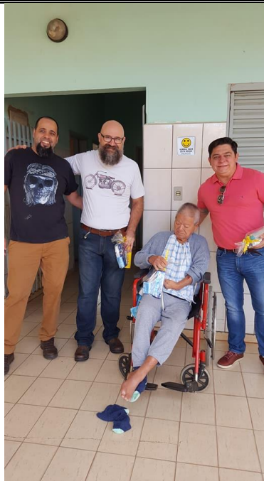
Turma de Pres. Prudente – vieram trazer kit's de higiene pessoal para todos os moradores – 13/05/2018