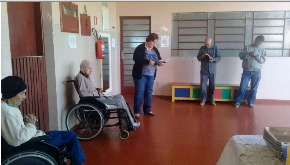
Membros da igreja Metodista – Alv. Machado – 20/05/2018