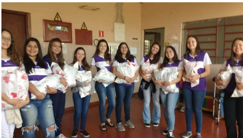
Grupo FILHOS DE JÓ – FRATERNIDADE FEMININA de Presidente Prudente – LUZ DO CONCLAVE – 25/05/2018