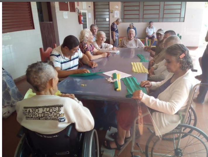
Atividade realizada em 11/05/2018 – A CORUJA E A ÁGUIA + OFICINA DE ARTES