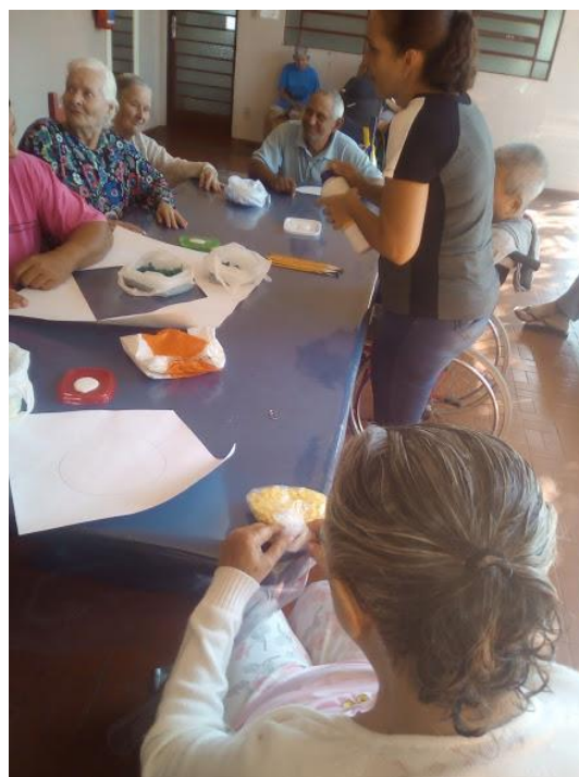
Atividade realizada em 18/05/2018 – A PAZ INTERIOR + OFICINA DE ARTES