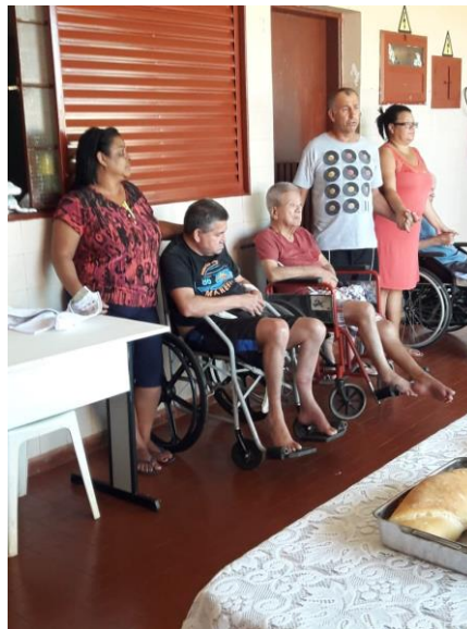
Setor Nossa Senhora de Lourdes – 22/04/2018