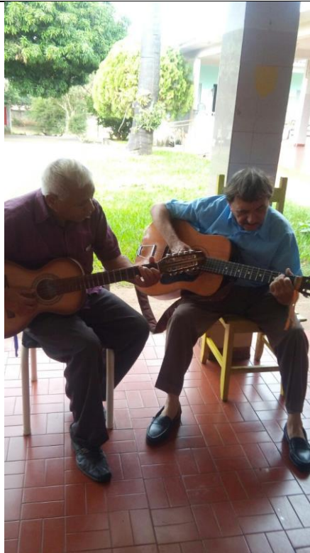
Violada para os idosos – 15/04/2018