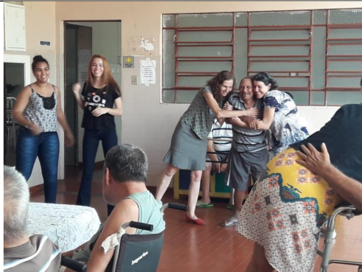
Assembléia de Deus – Pres. Prudente – 28/04/2018