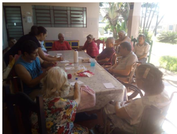
Atividade realizada em 27/04/2018 – O CAVALO BRANCO