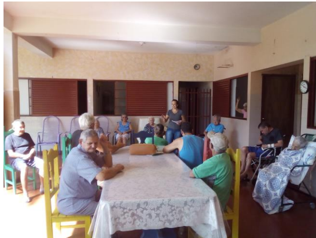
Atividade realizada em 20/04/2018 – O MENINO QUE CONSERTOU O MUNDO