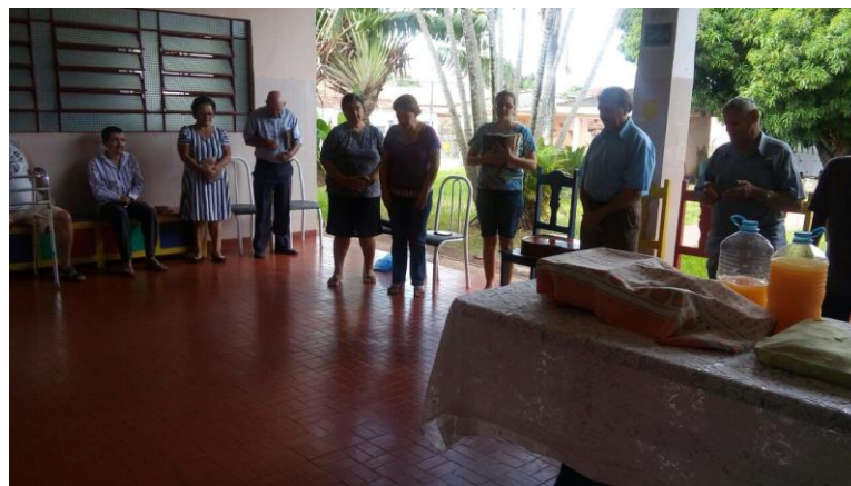
Membros da igreja Metodista – Alv. Machado – 15/04/2018