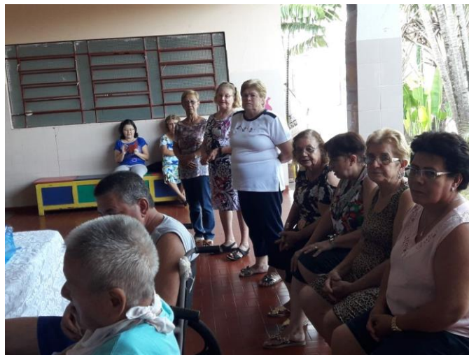
Setor Santo André – 08/04/2018