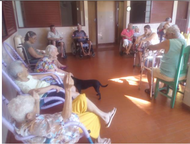
Atividade realizada em 13/04/2018 – FÁBULA DA FELICIDADE