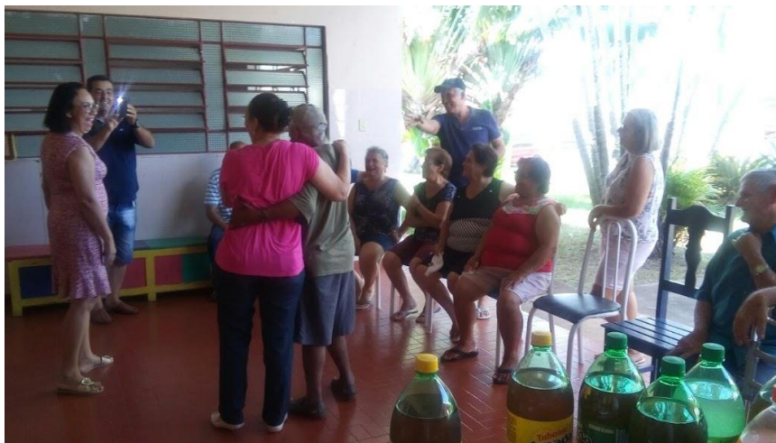
Setor Santa Bárbara – 29/04/2018