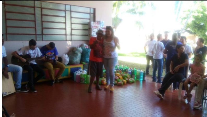
Ministério Mudança de Vida – Pres. Prudente – 21/04/2018